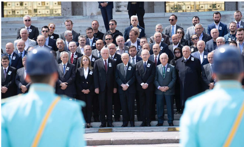
MHP Genel Başkanı Bahçeli ile eski CHP Genel Başkanı Kılıçdaroğlu törende yan yana saf tuttu.