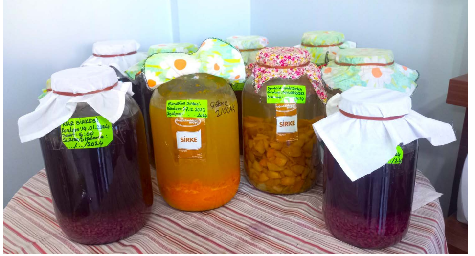
Osmancık'ta yaşayan İsmail Kavak, doğadan topladığı ve organik olarak temin ettiği meyvelerden çeşit çeşit sirke yapıyor.

Bu sirkelerimiz 8 ila 12 hafta arasında olgunlaşıyor. Temiz şişelerde karanlık serin bir ortamda durması gerekiyor. "dedi.