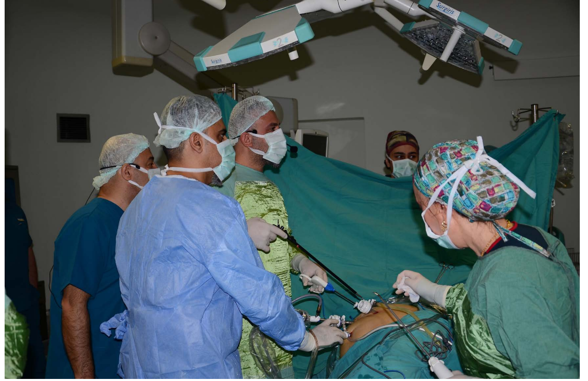
Canlı yayında kapalı tümörlü böbrek ameliyatı ve böbrek taşı operasyonu yaptılar